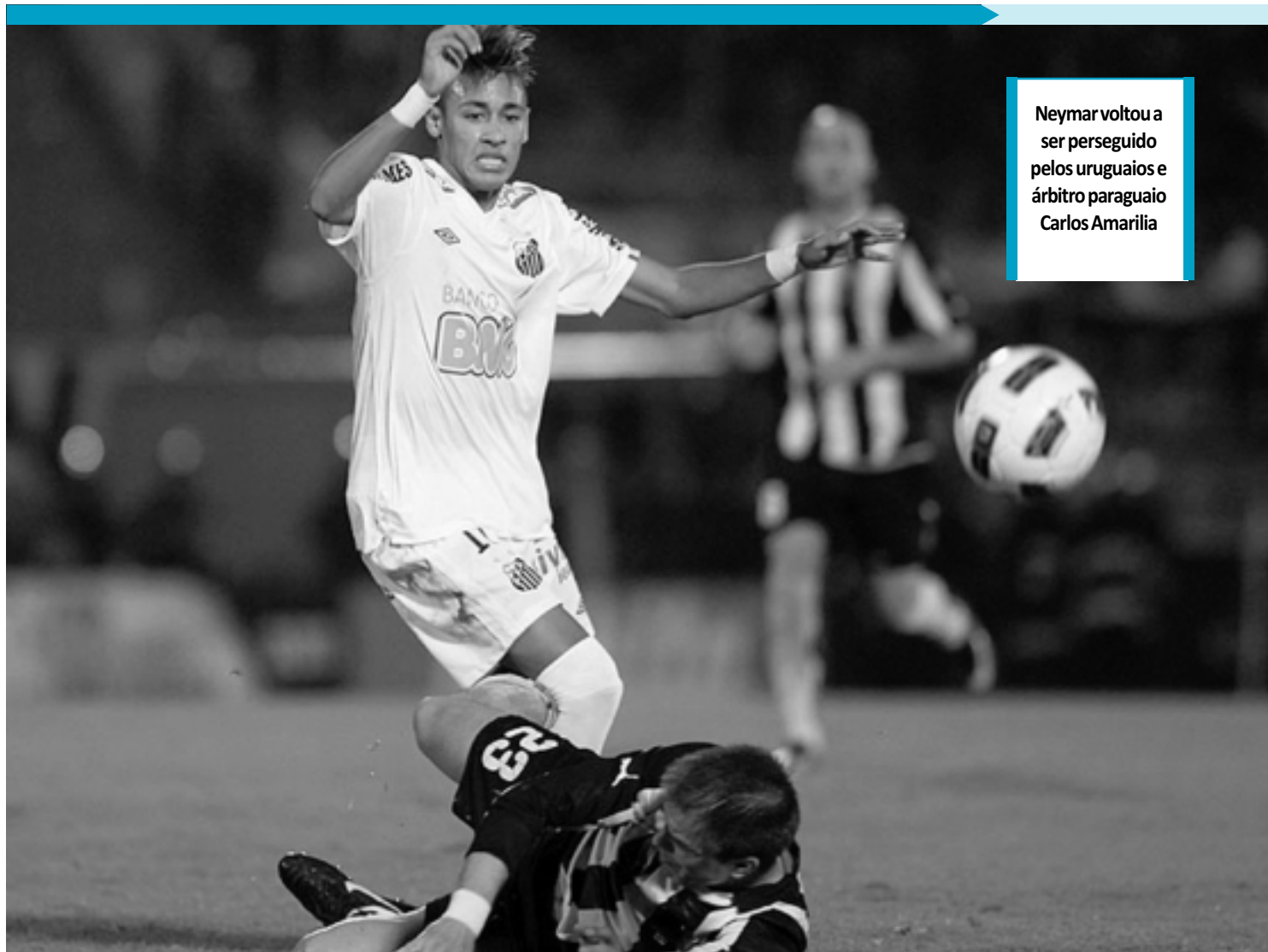
Neymar voltou a ser perseguido pelos uruguaios e árbitro paraguaio Carlos Amarilla

No Pacaembu, onde Santos e Peñarol se reencontram na próxima quarta-feira, a arbitragem ficará a cargo do argentino Sergio Pezzotta.