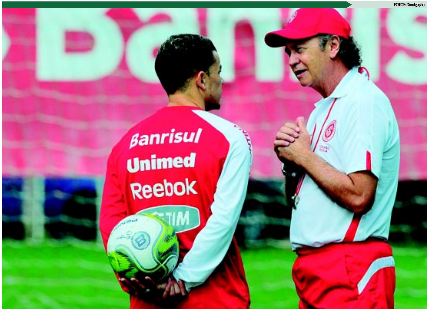
Falcão tem conversado muito com os jogadores, tentando impor uma nova filosofia de trabalho, que não tem sido bem assimilada pelo grupo