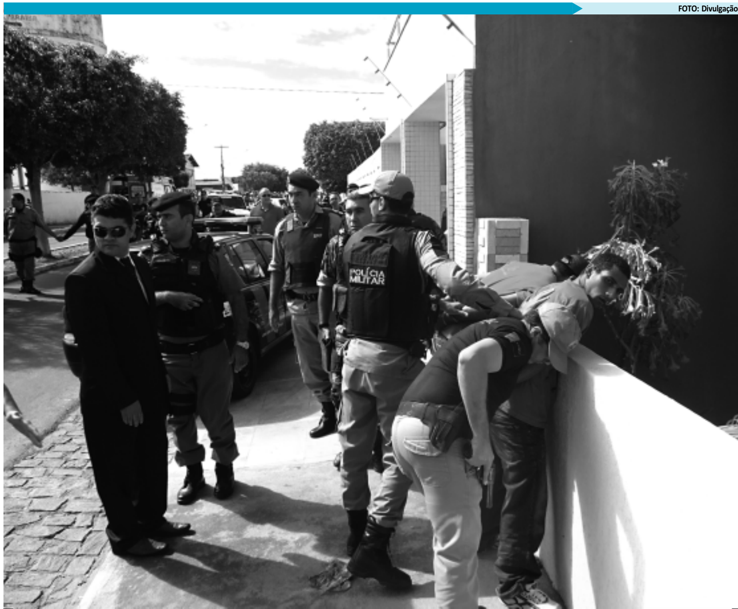
Após duas horas de negociações, os bandidos se entregaram à polícia. Dois deles são paraibanos e um é natural de Pernambuco e cumpria pena em Sousa

Os elementos exigiram a presença de um advogado da cidade de Cajazeiras que foi acionado rapidamente para acompanhar toda a negociação. Depois de duas horas de conversa, as duas reféns foram liberadas e os bandidos entregaram-se à