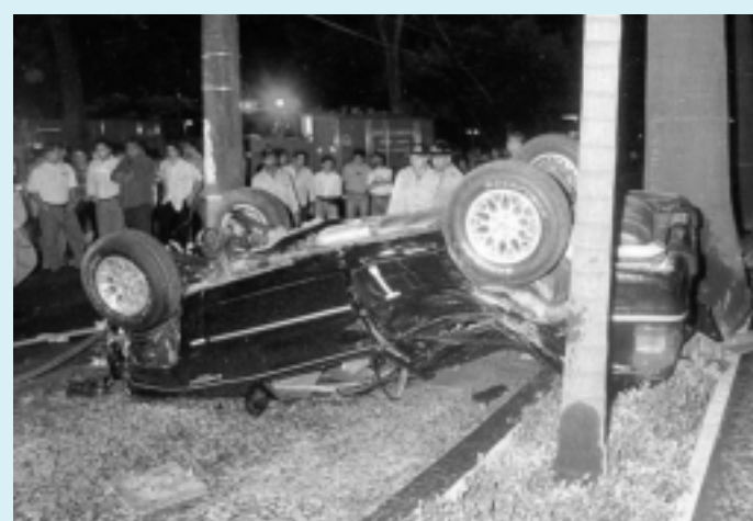
Jeep Cherokee de Edmundo capotou após colidir com um Fiat Uno

No mesmo ano, a habilitação de Edmundo foi suspensa por excesso de infrações. Em três anos, Edmundo acumulou 219 pontos no documento, marca quase 11 vezes superior à máxima permitida pelo Código Brasileiro de Trânsito.