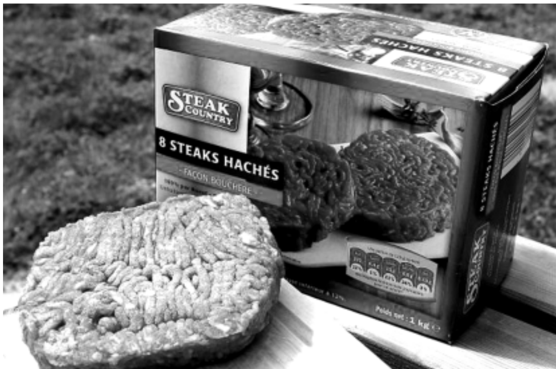
País desconfia que contaminação pode ter sido de carne vinda da Alemanha, da Bélgica e da Holanda

Vários movimentos políticos europeus, entre eles o italiano Liga Norte, protestam contra a presença de tantos imigrantes na Europa e pressionam para que adotem medidas severas contra esse fenômeno.