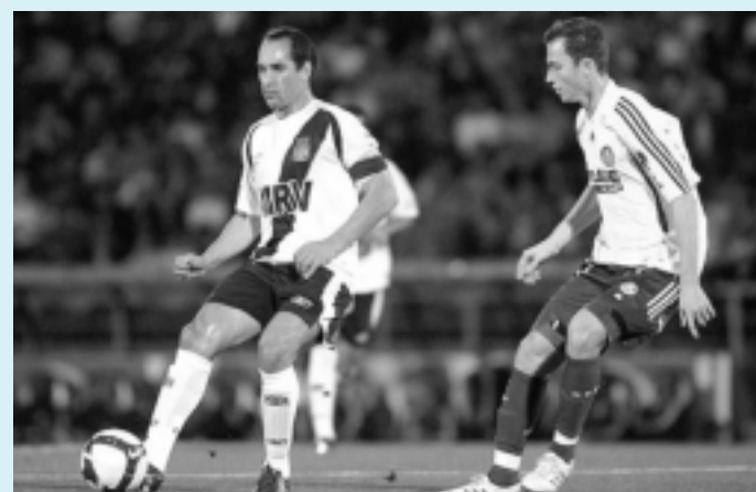
Atacante nos bons tempos como jogador do Vasco da Gama