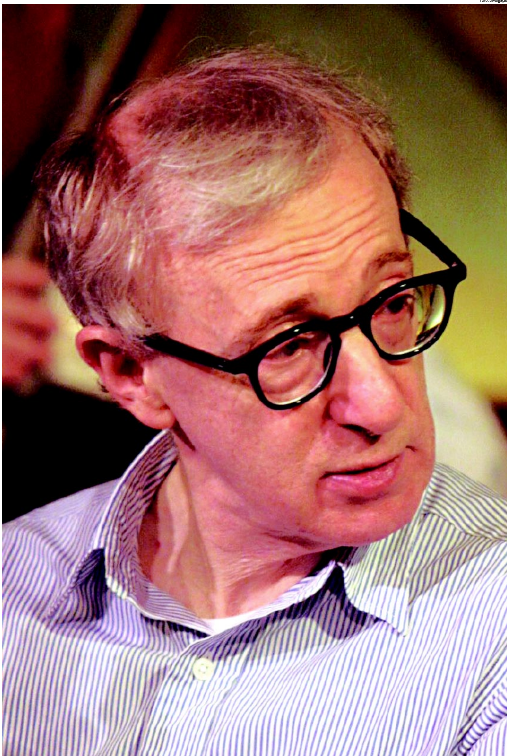
Woody Allen diz que Paris moldou o seu imaginário e o de muitos escritores e artistas e é essa magia da cidade que ele procurou retratar em seu novo filme