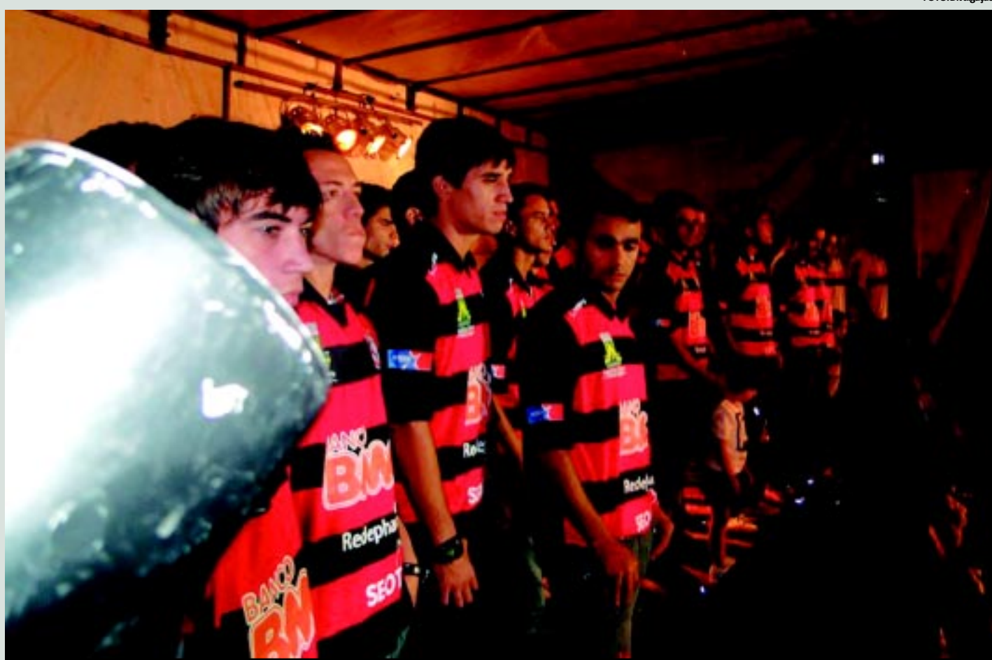
Os novos jogadores do Campinense para o Brasileiro da Série C foram apresentados na quarta-feira, 15, no estádio Renatão, em grande estilo