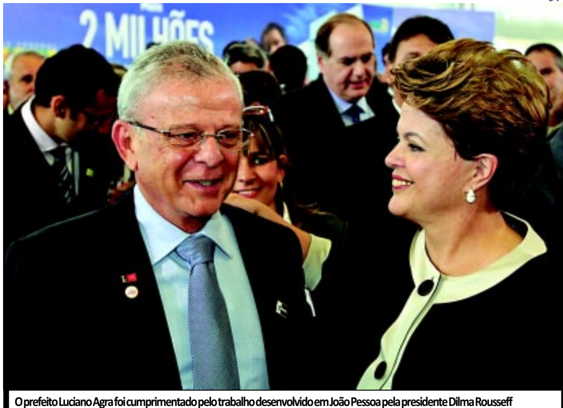
O prefeito Luciano Agra foi cumprimentado pelo trabalho desenvolvido em João Pessoa pela presidente Dilma Rousseff

O Sistema terá 112,5 quilômetros de extensão e interligará a Barragem de Acauã ao açude Araçagi, garantindo o abastecimento de água para as cidades da bacia litorânea, onde ficam localizados 60% da população do Estado. O investimento previsto para execução da obra será de R$ 980 milhões.