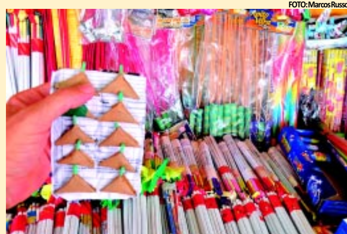
Consumidor deve pesquisar preços, que têm diferença de até R$ 120

A menor variação de preços é de 33% e ocorre na chuva de ouro pequena (dez unidades), com valores de R$ 15 a R$ 20, na caixa de mexicanito (quatro unidades) e no ra-