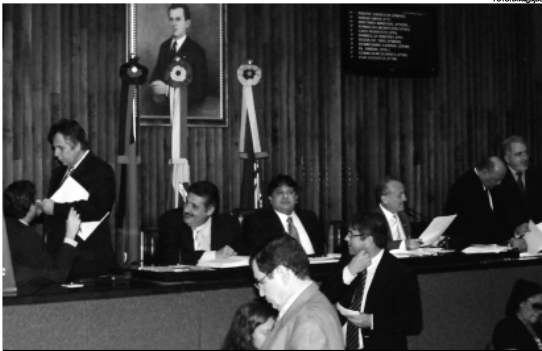
Deputados estaduais aprovaram 21 projetos e requerimentos na última sessão do semestre antes do recesso parlamentar